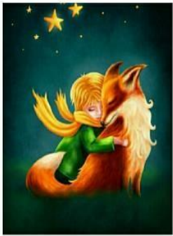
RENARD ET LE PETIT PRINCE