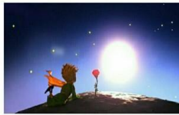
LE PETIT PRINCE ET LA ROSE

Le Prince n'aime pas le comportement de ces adultes, il s'oppose aux grandes personnes qui ne pensent qu'aux biens matériels et à l'argent.